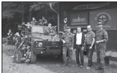
Copak je to za vojáka? No přeci kamarádi ze 102. průzkumného praporu z Prostějova